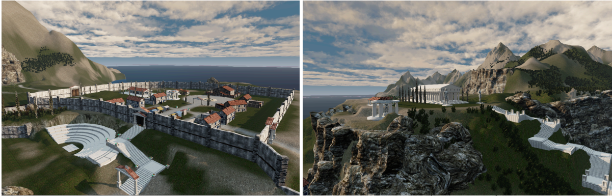
Figura 3: Imagens do game protótipo Wind Phoenix: Tales of Prometheus . À esquerda Ágora de Samos e à direita templo dedicado a Hera .

Com isso, descrevemos três elementos que se articulam e constituem nosso game : (1) Narrativa , o papel que desempenhamos no enredo; (2) Exploração , descobrindo os cenários e personagens ( NPCs 5 ), na busca por pistas e estabelecendo diálogos com NPCs no game ; (3) Puzzles , nossos desafios e representam, simultaneamente, obstáculos e motivadores para prosseguirmos na aventura. Para McGonigal (2012) os jogadores, efetivamente, não estão jogando sozinhos, não estão simplesmente tentando ganhar os jogos, eles estão em uma missão mais importante, tornar-se parte de algo épico.