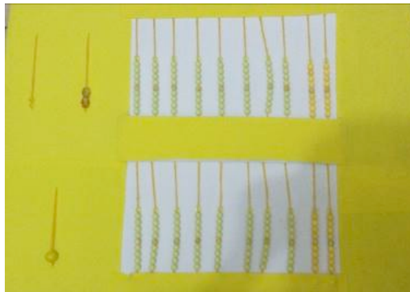
Figura 2: Representação da adição dos decimais 0,1 + 0,3 = 0,4