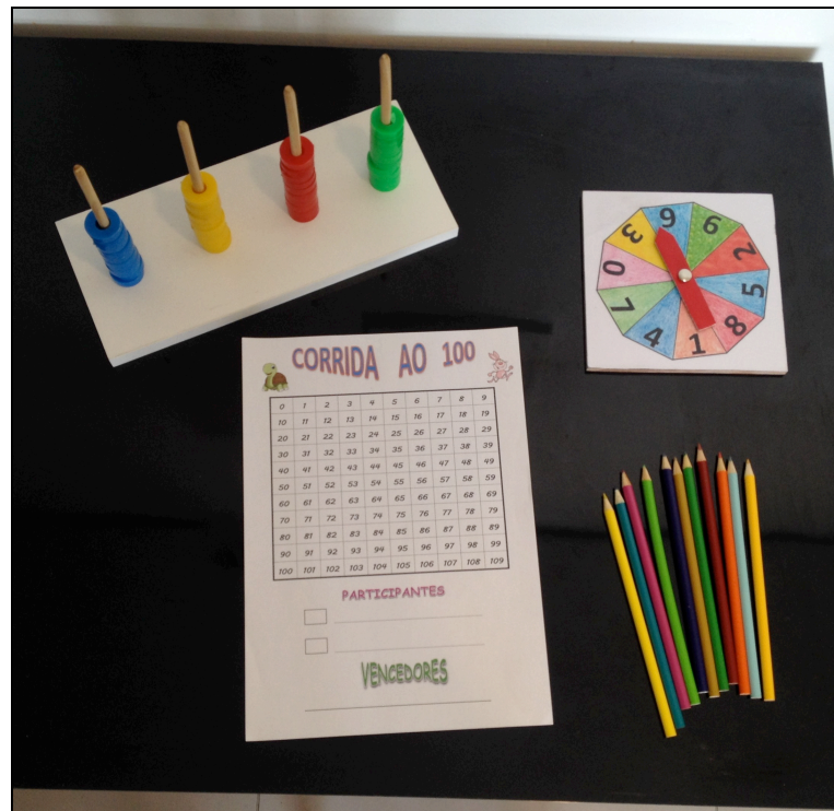
Figura 1 – Materiais disponibilizados para o jogo.

Materiais: um ábaco, uma roleta, uma cartela do jogo e lápis de cor para cada grupo (Fig. 1).