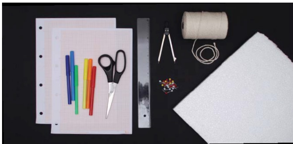
FIGURA 1 Recursos e materiais (FIRER, 2001, p.3).

Conforme a proposta do experimento e explicações contidas na atividade do Firer (2001), para a construção deste experimento é preciso utilizar recursos e materiais como: datashow, quadro negro, papéis quadriculados, caneta para cd, régua, tesoura, isopor, tachinha, barbante e caneta hidrográfica.