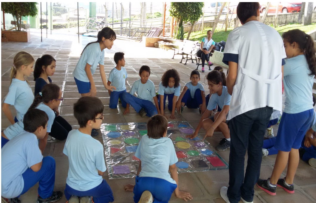
Figura 1: Jogo aplicado pelos professores