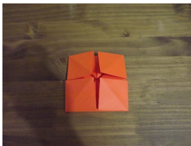
Figura 13 – Passo a passo origami

Já o nono e o décimo passo se configurou na problemática de formar quatro quadrados a partir dos dois trapézios existentes.