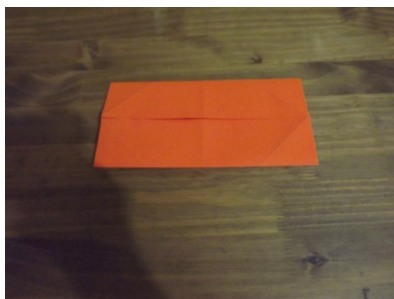
Figura 8 – Passo a passo origami

Após este passo, lançamos o quinto problema, que era o de obter dois retângulos menores ainda a partir dos outros dois retângulos feitos anteriormente.