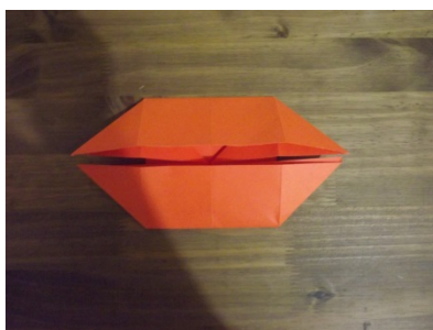
Figura 12 – Passo a passo origami

Já o nono e o décimo passo se configurou na problemática de formar quatro quadrados a partir dos dois trapézios existentes.