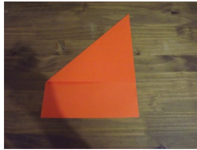
Figura 3 – Passo a passo origami