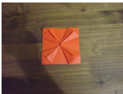
Figura 14 – Passo a passo origami

O passo final foi o de que os professores deveriam construir oito triângulos menores nas extremidades do origami a partir dos quatro triângulos criados anteriormente.