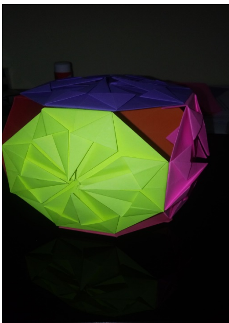
Figura 1 – Modelo Estrela Kusudama

Após lançada a ideia da construção do origami Estrela Kusudama, ouvimos muitos questionamentos por parte dos professores participantes, como por exemplo, “Não conseguirei fazer”, ou ainda, “Mas isso é muito difícil”. Partindo da proposta de que o origami seria construído a partir de situações problemáticas, lançamos nossa primeira problemática para os professores, sendo ela: “Como vocês obtêm a partir de uma folha sulfite, que é retangular, um quadrado?”. Enquanto os professores realizavam a dobradura solicitada, entrevistamos questionando os mesmos sobre qual o tipo de dobradura que deveria ser realizada para obter um quadrado a partir de um retângulo. Como pode ser visto nas imagens a seguir: