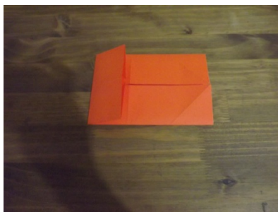
Figura 9 – Passo a passo origami

Após este passo, lançamos o quinto problema, que era o de obter dois retângulos menores ainda a partir dos outros dois retângulos feitos anteriormente.