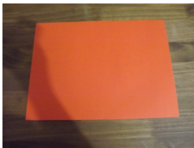
Figura 2 – Passo a passo origami

Após lançada a ideia da construção do origami Estrela Kusudama, ouvimos muitos questionamentos por parte dos professores participantes, como por exemplo, “Não conseguirei fazer”, ou ainda, “Mas isso é muito difícil”. Partindo da proposta de que o origami seria construído a partir de situações problemáticas, lançamos nossa primeira problemática para os professores, sendo ela: “Como vocês obtêm a partir de uma folha sulfite, que é retangular, um quadrado?”. Enquanto os professores realizavam a dobradura solicitada, entrevistamos questionando os mesmos sobre qual o tipo de dobradura que deveria ser realizada para obter um quadrado a partir de um retângulo. Como pode ser visto nas imagens a seguir: