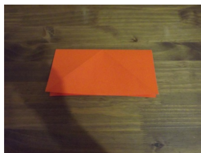
Figura 6 – Passo a passo origami

A terceira problemática para a construção do origami se configurou em obter dois retângulos a partir do quadrado anterior.