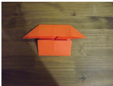
Figura 11 – Passo a passo origami

O sétimo e o oitavo problema se configurou na proposta de se obter dois trapézios a partir dos dois retângulos confeccionados anteriormente.