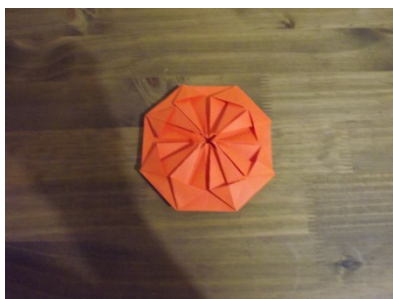
Figura 15 – Passo a passo origami

O passo final foi o de que os professores deveriam construir oito triângulos menores nas extremidades do origami a partir dos quatro triângulos criados anteriormente.