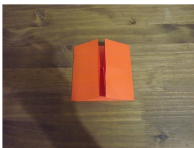
Figura 10 – Passo a passo origami