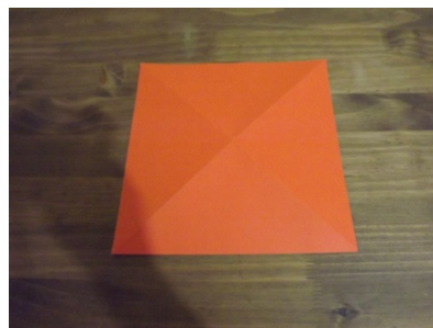
Figura 5 – Passo a passo origami

Após esta problemática inicial, partimos para a segunda etapa da construção do origami, onde os professores foram indagados sobre como poderiam obter quatro triângulos a partir de um quadrado.