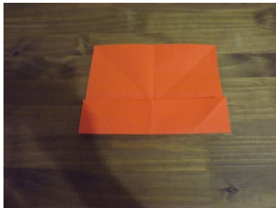
Figura 7 – Passo a passo origami

Seguindo os passos para a construção do origami, levantamos a quarta problemática, que se configura em obter dois retângulos menores a partir dos dois retângulos maiores confeccionados anteriormente.