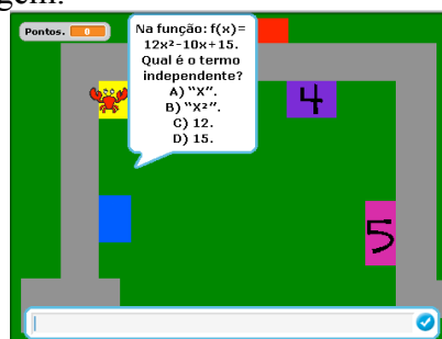
Figura 3 – Programa labirinto matemático

Uma questão que gerou respostas bem interessantes foi: dentro dos programas que desenvolvemos, quais os conteúdos de Matemática que você observou que utilizamos? Esperava-se que os discentes respondessem de forma padrão, falando apenas dos conteúdos base dos programas, por exemplo, equações ou operações Matemáticas básicas, porém, isso aconteceu apenas com o aluno “C” que, remetendo-se ao programa labirinto de Matemática , respondeu que “pra fazer um retângulo você tem que ter as medidas tipo de Matemática (SIC)” e aos outros programas se remeteu aos cálculos matemáticos dizendo que “tinham as contas pra fazer (SIC)” . A essa mesma questão o aluno “A” respondeu que “uma coisa que é bastante usada foi aquele plano cartesiano. No labirinto nós colocávamos pra ele não passar pras outras cores e usava o plano cartesiano (SIC)” . Percebe-se claramente nessa fala que o discente conseguiu fazer analogia do plano cartesiano com a construção de um labirinto, e que, através de coordenadas, foi possível limitar até que trechos da tela o personagem poderia chegar. Interessante perceber que o discente conseguiu transcender o padrão do plano cartesiano como um simples local para se marcar pontos e desenhar gráficos. A figura 3 ilustra o programa do labirinto que foi comentado pelos alunos. Nesse jogo, o personagem deveria ir caminhando ao longo do percurso cinza e tocando nos números para responder às questões Matemáticas que surgem.